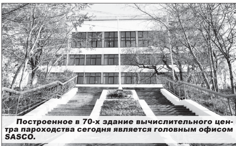
Построенное в 70-х здание вычислительного центра пароходства сегодня является головным офисом SESCO.