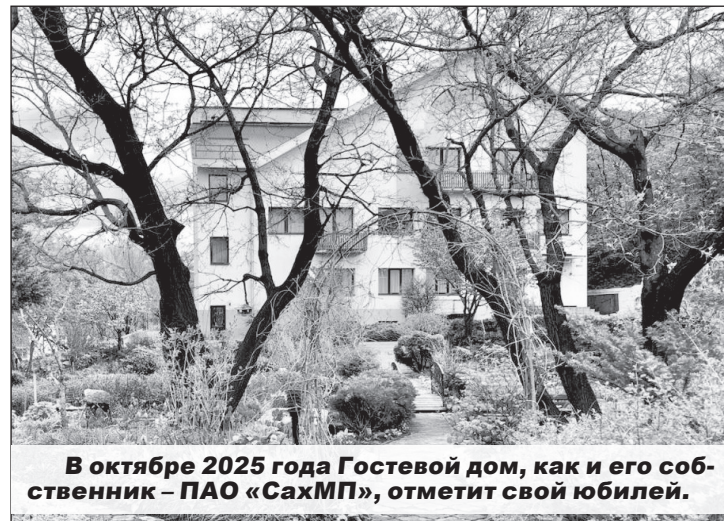
В октябре 2025 года Гостевой дом, как и его собственник – ПАО «СахМП», отметит свой юбилей.

И, конечно же, нельзя обойти вниманием информацию, озаглавленную «Сахалины» на Балтике». Ухудшение экономической ситуации в стране, рост железнодорожных тарифов привели к сокращению грузовых потоков, в т.ч. на Сахалин, поэтому руководство пароходства приняло решение оставить на линии Ванино – Холмск шесть из имевшихся восьми паромов. Дизель-электроходы «Сахалин - 8, 9» были направлены в Калининград в распоряжение специально учреждённой компании «Саско, Калининград». К слову, их экипажи формировали на контрактной основе в основном из моряков СахМП. Вот так два из десяти красавцев-«Сахалинов» волею судеб не только вновь побывали, но и поработали на своей «исторической родине» ☺.