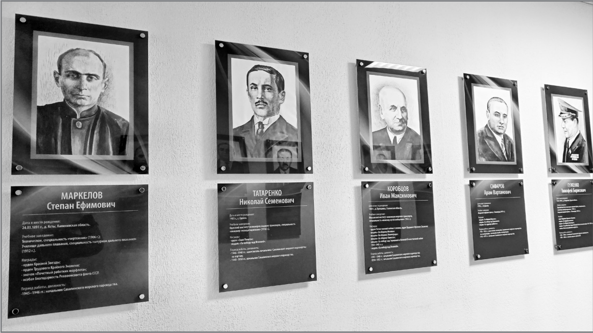
Галерея «Они прокладывали курс СахМП» на административном этаже головного офиса SASSO.

Мы рады вновь приветствовать вас, дорогие читатели, на страницах «Сахалинского моряка»! Представляем вашему вниманию новую рубрику «Рулевые СахМП». В ней мы расскажем о бывших руководителях пароходства и важных вехах развития предприятия, связанных с их именами, а также поделимся воспоминаниями ветеранов отрасли о тех, кто в разное время стоял у штурвала СахМП.