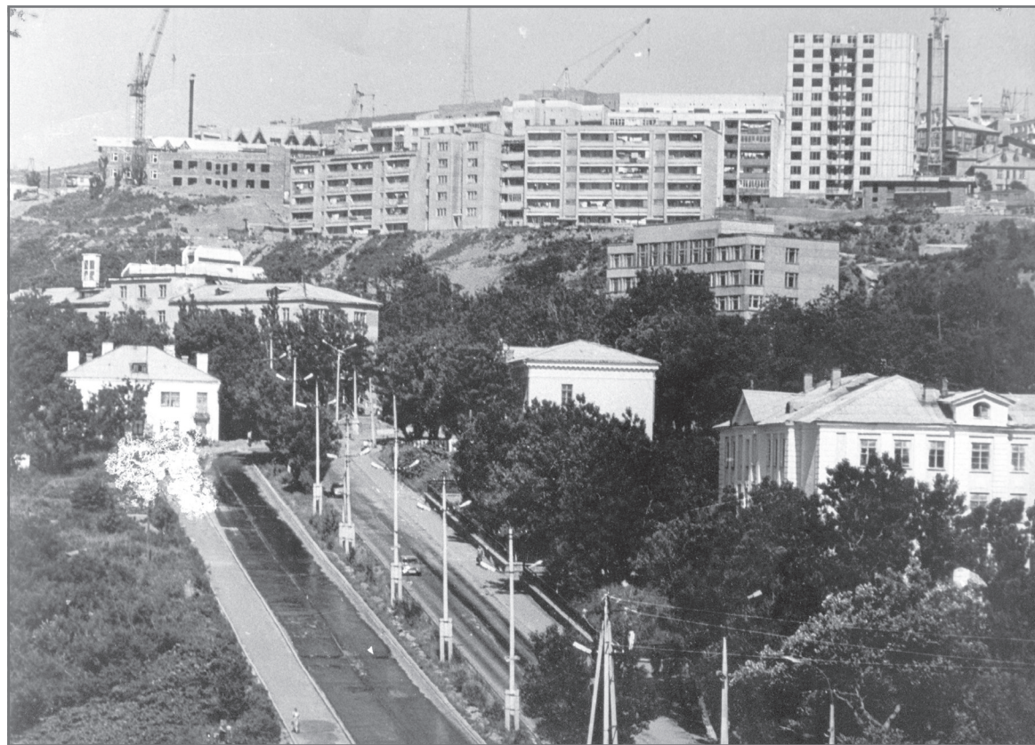
Без преувеличения более половины зданий в Холмске возведено строительством-монтажным управлением Сахалинского морского пароходства.

● Опубликованный радиобюллетень ММФ буквально приковывает к себе внимание, и вот почему. Одновременно строящейся группе судов, включающей 46 (!) единиц, присвоены названия, новые борта закреплены за пароходствами,