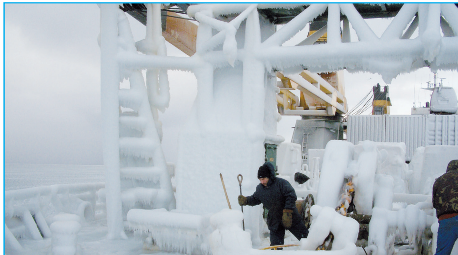
Коварное зимнее море.

Беседовала Юлия КИМ.