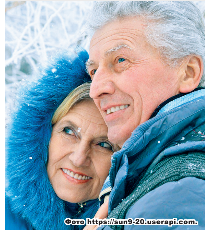
Фото https://sun9-20.userapi.com .