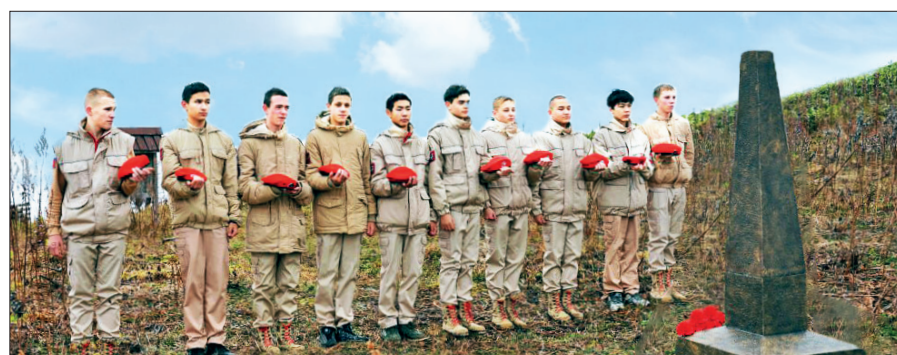
В октябре 2024 г. на горе Татарской был установлен памятный знак в честь воинов 113-й отдельной сахалинской стрелковой бригады, в августе 1945 года освободивших г. Холмск от японских захватчиков.

нем такую острую тему, как вандализм. В конце прошлого года в Холмске после масштабной реконструкции была открыта обновлённая площадь Мира, а уже в январе 2025-го вандалы повредили на объекте малые архитектурные формы. Кроме этого, злоумышленники регулярно наносят ущерб общественным туалетам. При обустройстве нового экологического парка планируется ли осуществлять контроль за сохранностью объектов?