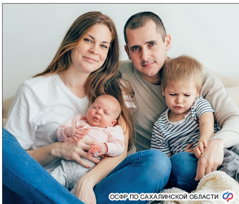
ОСФР ПО САХАЛИНСКОЙ ОБЛАСТИ

Для получения единовременного пособия необходимо подать заявление в любой клиентской службе Отделения СФР по Сахалинской области, МФЦ или на портале госуслуг в течение 6 месяцев с момента официального усыновления, установления опеки (попечительства) либо принятия ребёнка в семью. К заявлению необходимо приложить копию решения суда об усыновлении. Телефон единого контакт-центра ОСФР по Сахалинской области 8-800-100-00-01 (звонок бесплатный).