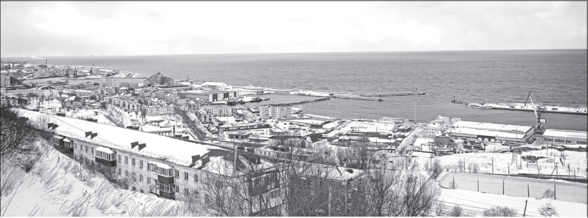
Со смотровой площадки, обустроенной на лестнице, соединяющей улицы 60 лет Октября и Крузенштерна, открывается прекрасная панорама центральной и северной части города.

Справка «СМ» Всероссийский конкурс путешествий «Дальний Восток — Земля приключений» проводится по инициативе Юрия Трутнева при поддержке аппарата полномочного представителя Президента РФ в ДФО, Минвостокразвития России, АО «Корпорация развития Дальнего Востока и Арктики», НКО «Фонд развития социальных инициатив». Основные цели конкурса: - увеличение интереса у жителей России к Дальнему Востоку, его природе и истории; - привлечение жителей России к путешествиям в регионы Дальнего Востока.