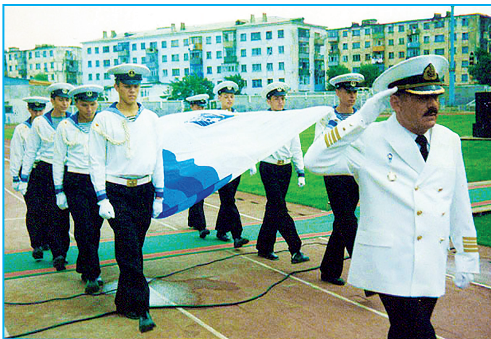
Знаменная группа Сахалинского мореходного училища. Стадион «Маяк Сахалин», начало 2000-х.

Подготовила Людмила ОРЛОВА.