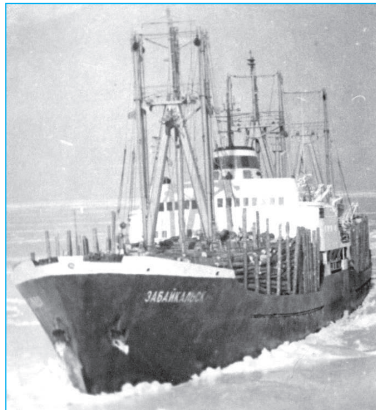
2 октября 1978 г. на т/х «Забайкальск», находясь в рейсе, произошло ЧП. Благодаря грамотным действиям экипажа судно и люди не пострадали.