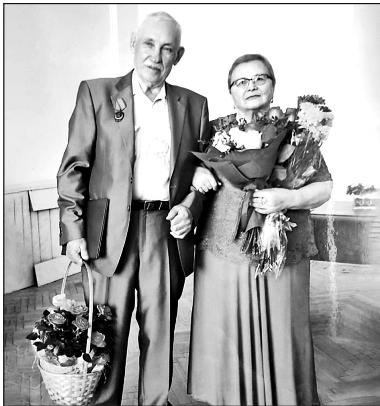
На праздновании «золотой» свадьбы во Дворце бракосочетания г. Улан-Удэ, 2017 год.