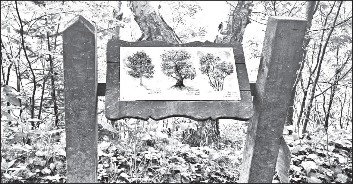
Выставка рисунков под открытым небом на озере Верхнем была открыта в День рождения с. Чехов, 7 сентября 2024 года.