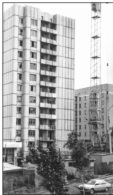
Первый в Холмске 12-этажный жилой дом по ул. Капитанской, возведённый в 1991 г. СМУ СахМП.