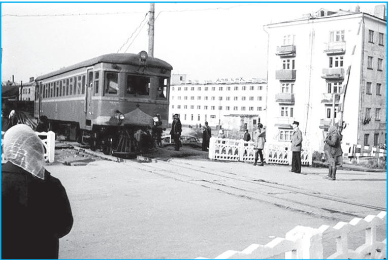
Железнодорожный переезд на улице Морской, начало 60-х.

От автора. В публикации использованы материалы книги «В нашу гавань заходили корабли» (2015 г., составитель М.И. Стрелова) и архивные данные. Раритетные фотографии - из архива проекта «Старый Сахалин» (oldsakhalin.ru), архива «СМ».