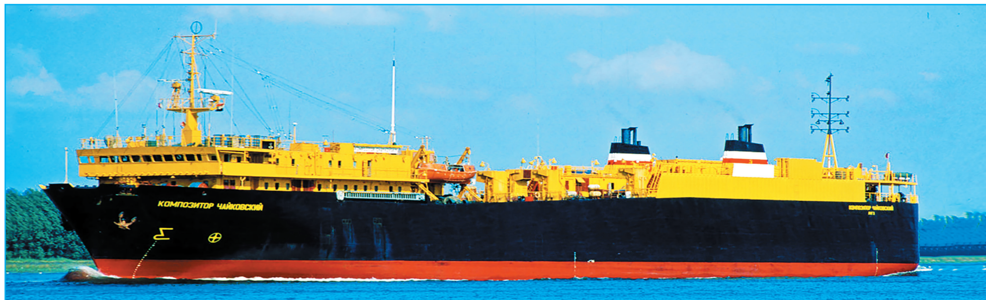
Трейлер-«медалист» СахМП «Композитор Чайковский».