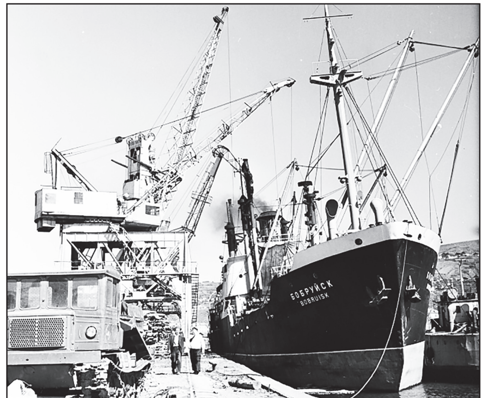
Пароход «Бобруйск» доставил с материка трелёвочные тракторы, порт Холмск, 1961 год.