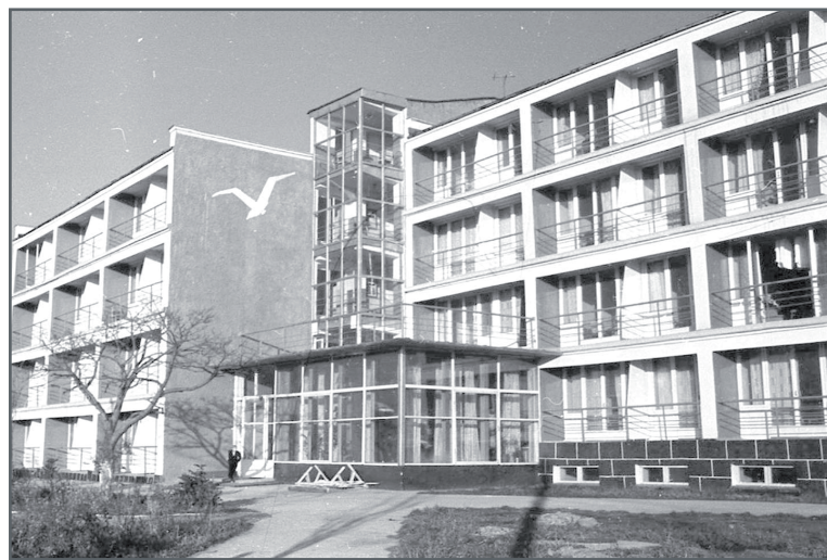
Общежитие плавсостава СахМП «Чайка».