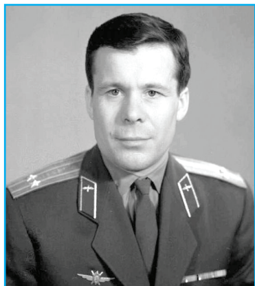
Е. Хрунов.

Всесоюзная стройка набирала обороты. К ней было приковано внимание всей страны. В сентябре на Сахалин вместе с супругой прибыл лётчик-космонавт СССР, Герой Советского Союза Е.В. Хрунов. Почётный гость