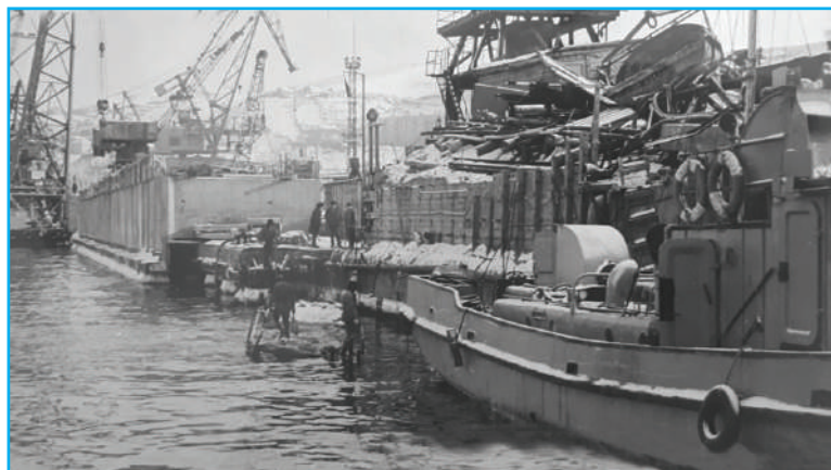
Холмск. Общий вид строительства переправы, 1972 г.