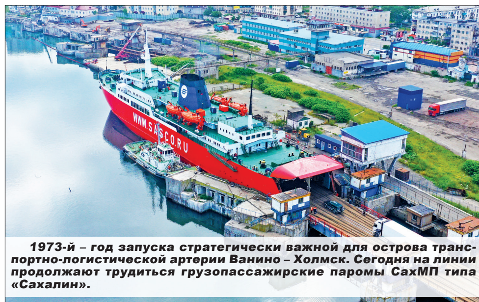
1973-й – год запуска стратегически важной для острова транспортно-логистической артерии Ванино – Холмск. Сегодня на линии продолжают трудиться грузопассажирские паромы СахМП типа «Сахалин».

P.S. В публикации использованы материалы книги «В нашу гавань заходили корабли» (2015 г., составитель М.И. Стрелова) и архивные данные.