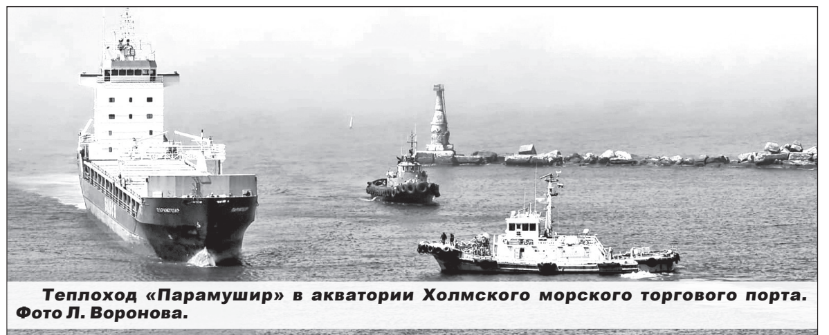
Теплоход «Парамушир» в акватории Холмского морского торгового порта.

На ежегодном собрании акционеров общества в 1999 году было озвучено, что пароходство стабилизировало свою производственную деятельность. В 2000-м Я.Ж. Алеgedпинов отмечал: «После продолжительного зстоя реанимируется грузовая база. Длительное время суда Сахалинского пароходства не ходили на Магадан, сейчас возросший на север грузопоток позволяет поставить на магаданскую линию второе судно. (Окончание на стр. 5.)