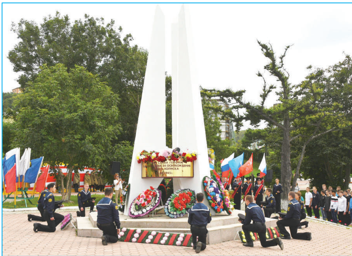
Братская могила советских воинов, павших в августе 1945 года в боях за освобождение Южного Сахалина от японских милитаристов.

Курильская десантная операция началась в ночь с 17 на 18 августа с высадки десанта на о. Шумшу. Боевые действия на островах Курильской гряды полностью завершились к 1 сентября.