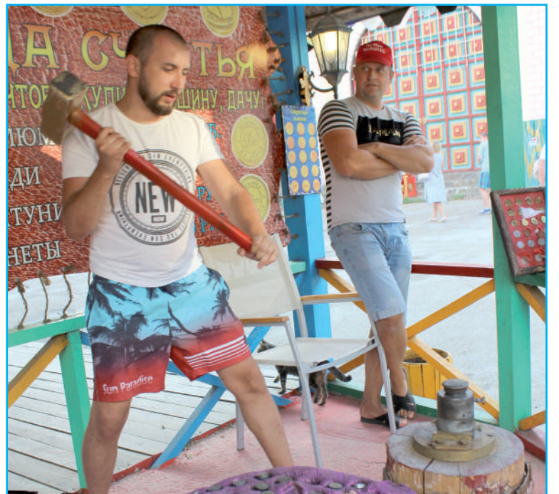
Аттракцион «Монета на счастье».

К сожалению, всему приходит конец. Вот и моя дивноморская сказка завершилась. Я вышла из отпуска и автоматически вернулась к прежней схеме жизни: работа — дом — работа.