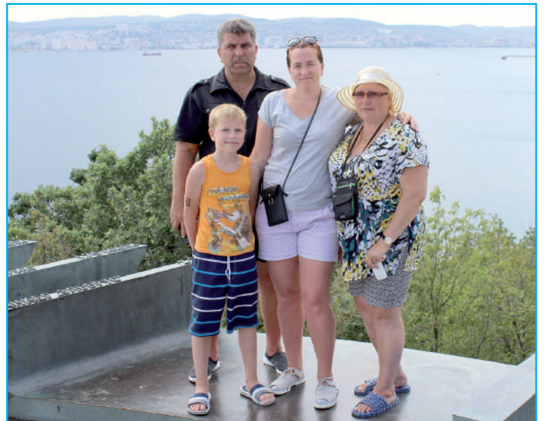
Фото на память на фоне Новороссийска.