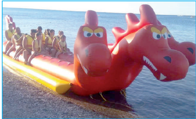
К заплыву готовы!

Я уже говорила, что организаторы отдыха приготовили для россиян, так и не попавших этим летом в отпуск за рубеж, массу различных экскурсий. Причём туры были смешанными. Если ранее вы целенаправленно отправлялись в Абрау-Дюрсо, чтобы пройтись спокойно по цехам старейшего завода по производству шампанских вин в Советском Союзе (а теперь в России), сфотографироваться на фоне лежащих на полках шкафов в пыли и темноте винных погребов бутылок, посмотреть шоу поющих фонтанов, то сегодня несколько основных звеньев может выпасть из общей программы тура. Но эти упущения организаторы пытаются восполнить показом других интереснейших мест в регионе. К примеру, мы приобрели поездку на грязевой вулкан Тиздар с купанием в Азовском море, посещением долины лотосов, просмотром увлекательнейшего конного представления. Сказать, что было здорово — не сказать ничего. Всё это надо увидеть собственными глазами и прочувствовать. И знаете, плюхаясь в грязевом «бассейне», пробиваясь на моторке через речные заросли к костровкам лотосов, наблюдая за тем, как блестяще выполняют свои трюки наездники, я была счастлива.