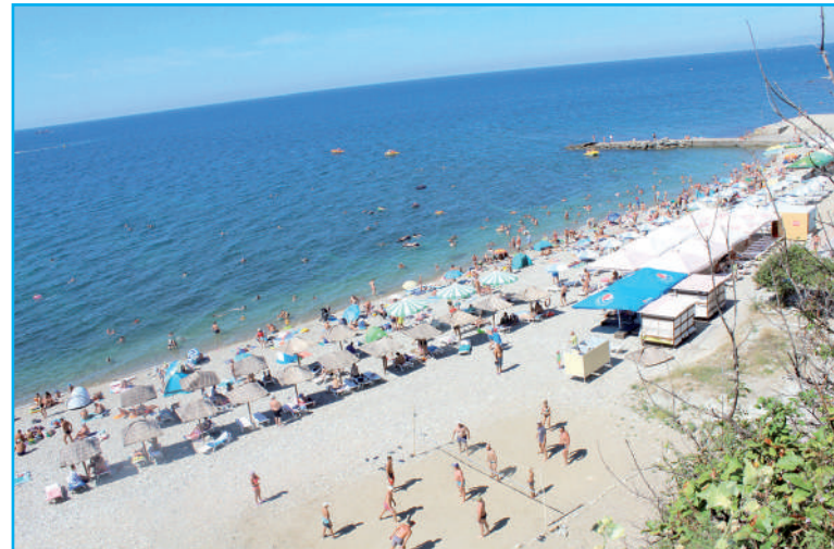
Неофициальный пляж «Факел».

В плетёной корзиночке на микроволновке в кухне-гостиной мы нашли визитки с телефонами служб такси и автопроката. Вот только контактов точек общепита, доставляющих