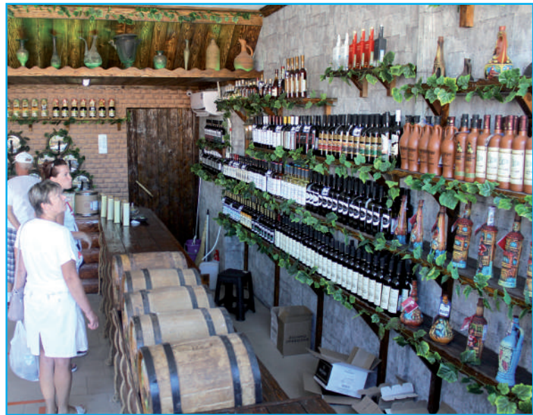
Покупать вино лучше в специализированном магазине.

И коль уж мы заговорили о напитках, остановимся на этом моменте поподробнее. Согласитесь, побывать в Краснодарском крае и не отведать местного вина — преступление. Конечно, если приобрести алкоголь с рук, то велика вероятность нарваться на «ле-