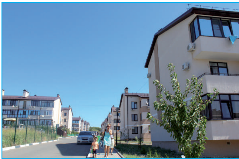
Типовые трёхэтажки жилкомплекса «Легенда».

Мы перерегистрировали билеты и стали ждать дня, когда можно будет отправиться в путь-дорогу к Чёрному морю.