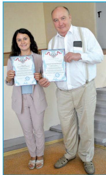
Спонсорам - благодарственные письма.