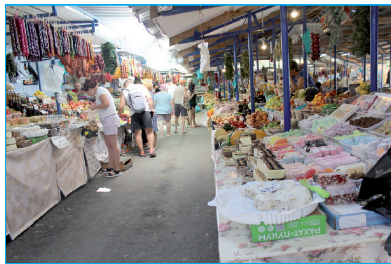
На этом рынке можно найти всё.

Возле дома машину встретила соседка арендодателя. Она любезно сопроводила нас до нового места проживания, вручила ключи от входной двери и быстро удалась. Мы принялись знакомиться с квартирой. В нашем распоряжении оказались гостиная (она же кухня) и маленькая комнатка, которая прежде была обычным балконом, с единственным в жилище окном. В обоих помещениях стояли одинаковые бюджетные диваны-кровать. Поначалу они показались нам вполне удобными, но позднее мы поняли - это далеко не так. С непривычки после сна ломало спину. И ещё был один нюанс. Когда мы при-