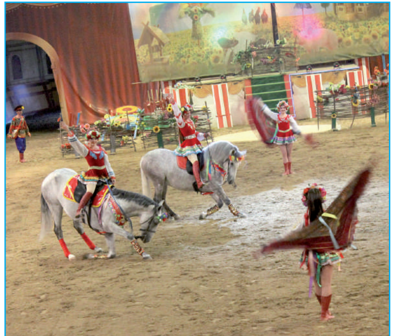
Конное представление «Малиновки».

вого» продавца, что чревато серьёзными последствиями для здоровья. Ещё три года назад Андрей предупреждал нас: нельзя покупать спиртное у незнакомцев. А как тут человеку не соблазниться? Он идёт по селу и чуть ли не на каждом углу встречает вывеску: «Продаётся домашнее вино». Ключевое здесь второе слово. И многие приезжие клюют на эту удочку. Знакомый нам объяснил, что такие «вина» делаются следующим образом: в бочку заливается вода, добавляются химические ингредиенты, придающие содержанию естественный аромат. Основная составляющая пойла для отдыхающих — спирт, причём явно не класса «Экстра». Для убийности в эту