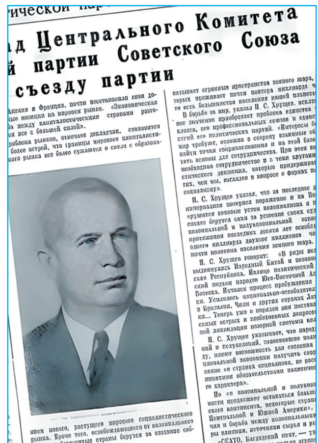
То самое фото Н.С. Хрущёва, опубликованное в «СМ».

• «Большое значение имеет намеченное Центральным Комитетом упорядочение пенсионного обеспечения с тем, чтобы значительно увеличить размеры низших разрядов пенсий, а размеры неоправданно высоких пенсий снизить, улучшение