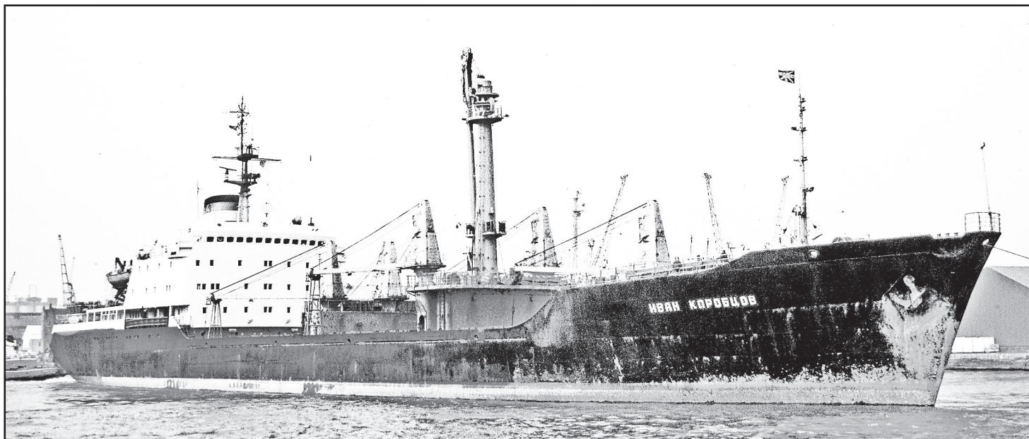
В 1972 году со стапелей Херсонского судостроительного завода был спущен на воду теплоход «Иван Коробцов» (порт приписки Новороссийск). Судно было утилизировано двадцать лет спустя.