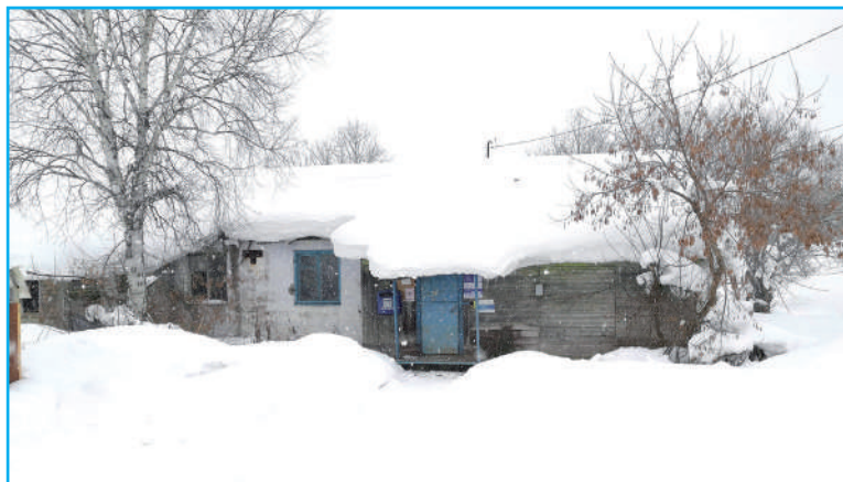
Так почтовое отделение в с. Пятиречье выглядит зимой...