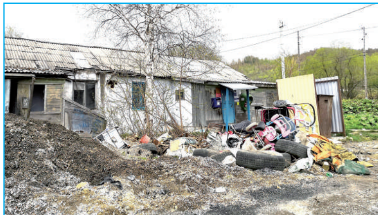
...а так - летом.