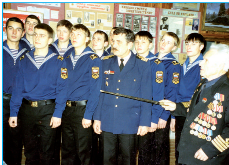
«Золотой фонд» СахМП