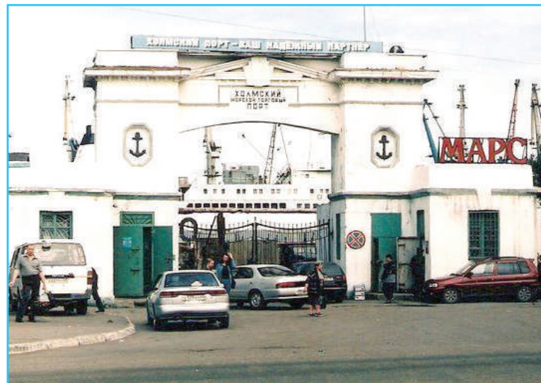
Ворота Холмского морского торгового порта.

• По окончании монтажных и пусконаладочных работ на 53-м причале Владивостокского морского контейнерного терминала введён в эксплуатацию портальный кран Liebherr максимальной