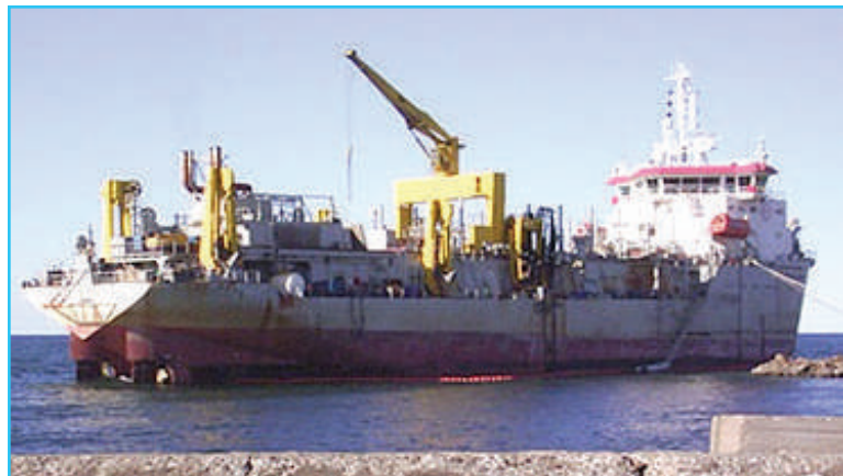
Севшее на мель в районе Приморского бульвара бельгийское судно «Христофор Колумб».

Коньков. Корреспондент «СМ» Анатолий Мирный посвятил ему материал «А ведь жизнь – интересная штука». 31 октября 2023 года ветеран компании, отдавший пароходству 50 лет, вышел на заслуженный отдых. Подробнее об этом читайте на стр. 4.