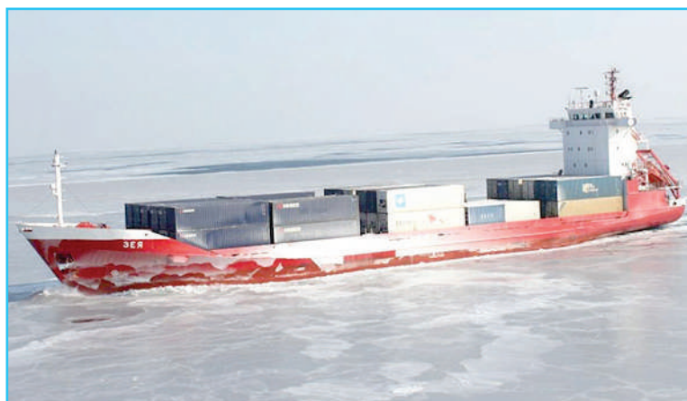
Контейнеровоз «Зоя» в очередном рейсе.

• 18 ноября в немецком порту Фленсбург состоялась передача ОАО «Сахалинское морское пароходство» контей-